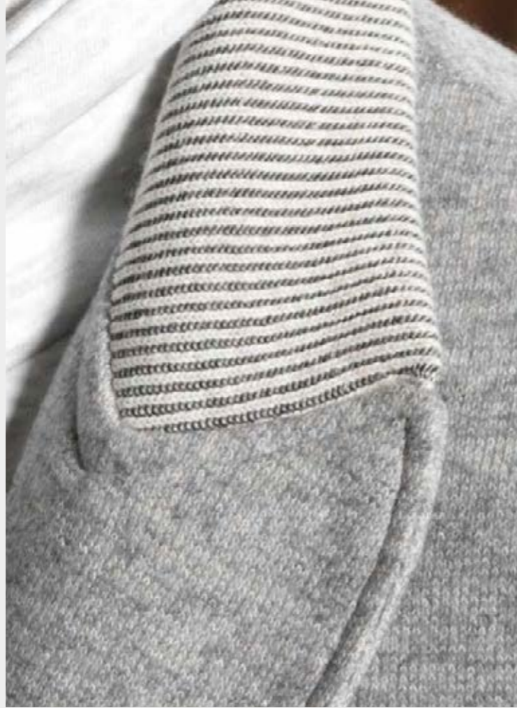
Jerseysakko Caesar 81303 11621 8120