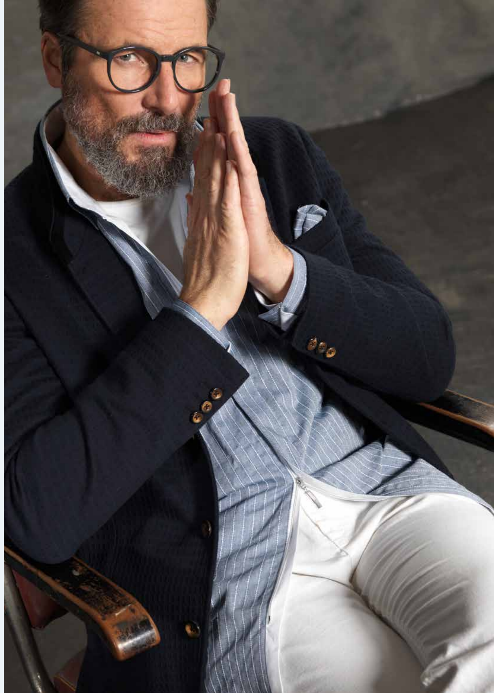
Hemd Ramon 164003 8764 10