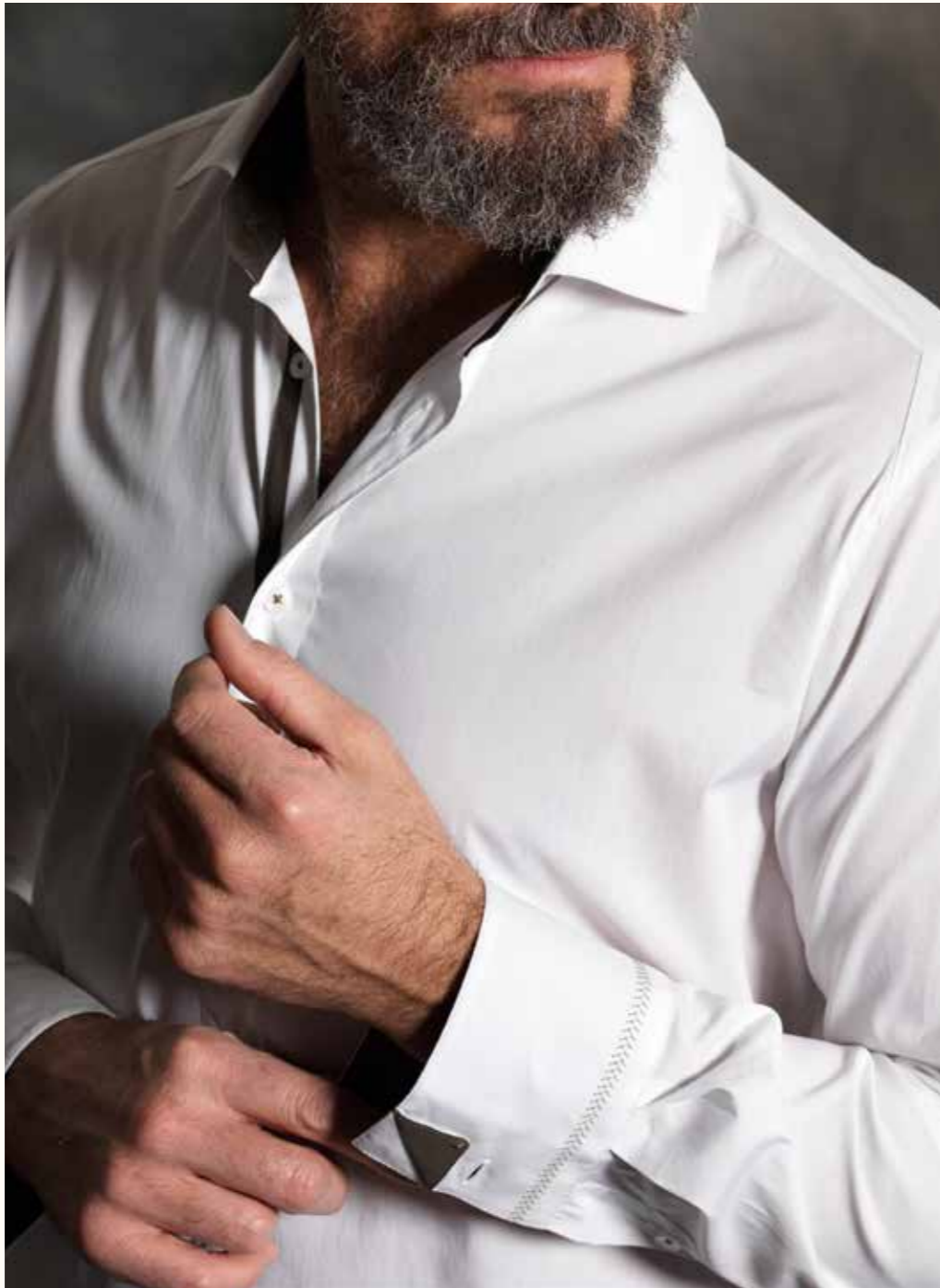
Hemd Halvor 92401 8771 00