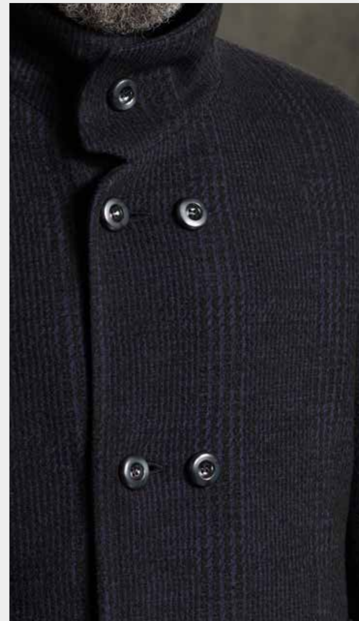
Mantel Columbus 92601 13921 8121