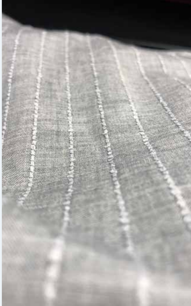
Hemd Garmond 81403 163003 8764 30

HARTWICH STEHT FÜR DEN REISSVERSCHLUSS STATT KNÖPFE UND FÜR DEN KLASSISCHEN STEHKRAGEN AM HEMD. VIELE MÄNNER LIEBEN DIESE KOMBINATION, WEIL KOMFORT UND STIL EINE KOMBINATION SIND, DIE UNVERGÄNGLICH IST. UND WER NÄHT SCHON GERN KNÖPFE AN?