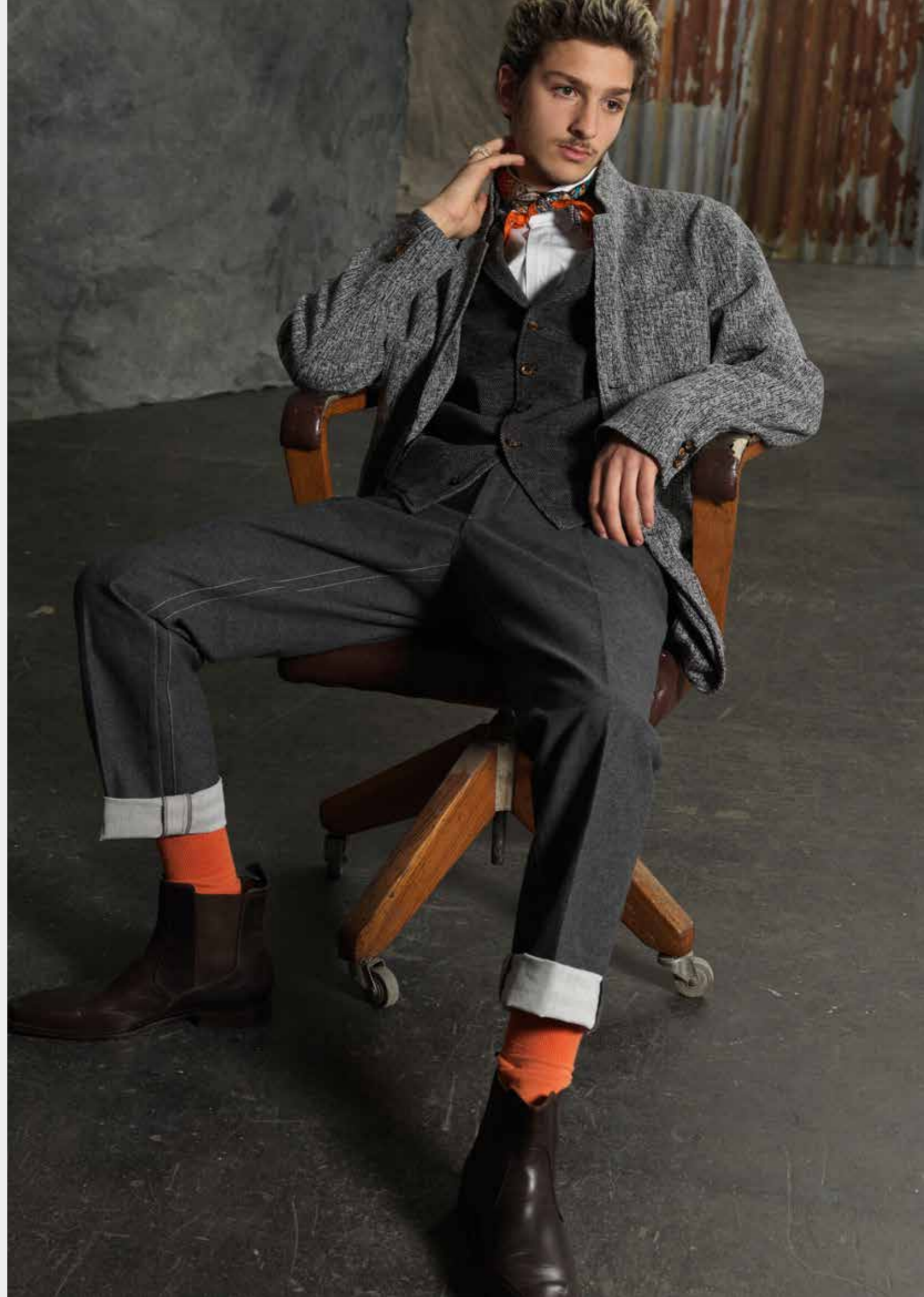
Hose Xerxes 72902 40521 8112