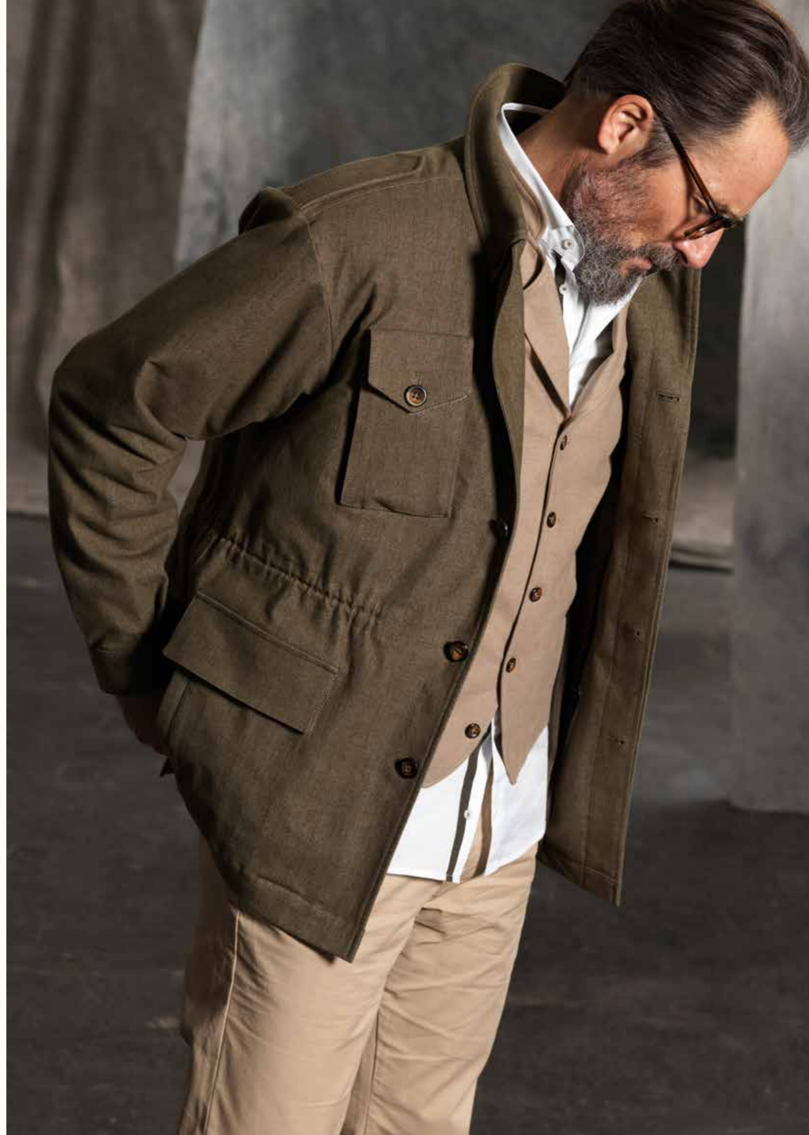
Weste Cruso 71801 10650 8112