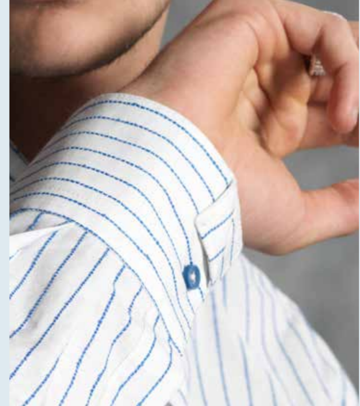
Hemd Ferry 92402 8764 19