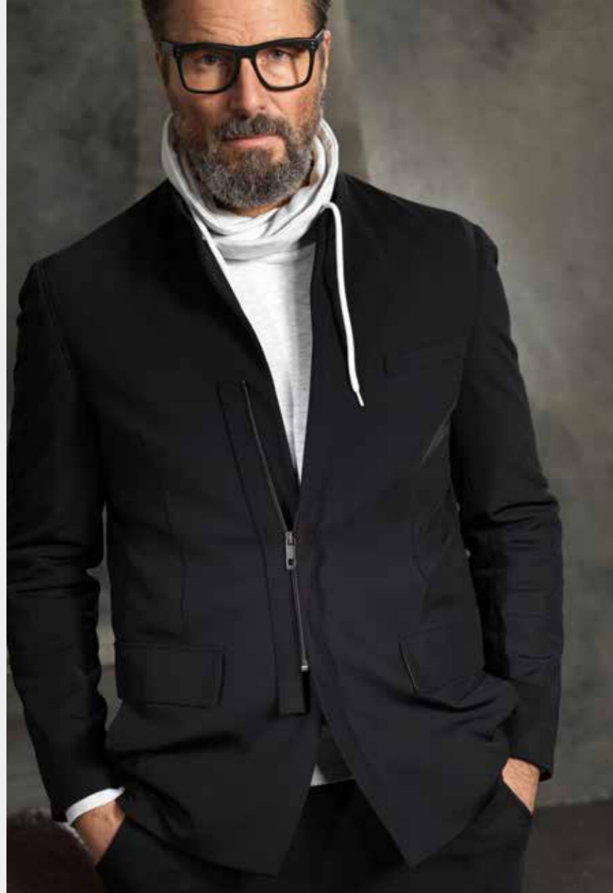
Jerseysakko Arminius 92301 13881 8124

HERBST UND WINTER FORDERN INTELLIGENTE STOFFE. IN KOMBINATION MIT SPORTLICHEN LINIEN VERWISCHEN DIE GRENZEN ZWISCHEN CASUAL UND „OFFIZIELL“. DAS IST TYPISCH FÜR MODE VON HARTWICH. DER JERSEYSTOFF DIESES SAKKOS IST AUS FUNKTIONSTOFF, AUS DEM SONST NUR JOGGINGANZÜGE GEMACHT WERDEN. ER IST ATMUNGSAKTIV, TROCKNET SCHNELL UND HAT EINE GRÜNE SEELE, SEIN GARN WURDE AUS RECYCELTEM KUNSTSTOFF HERGESTELLT.