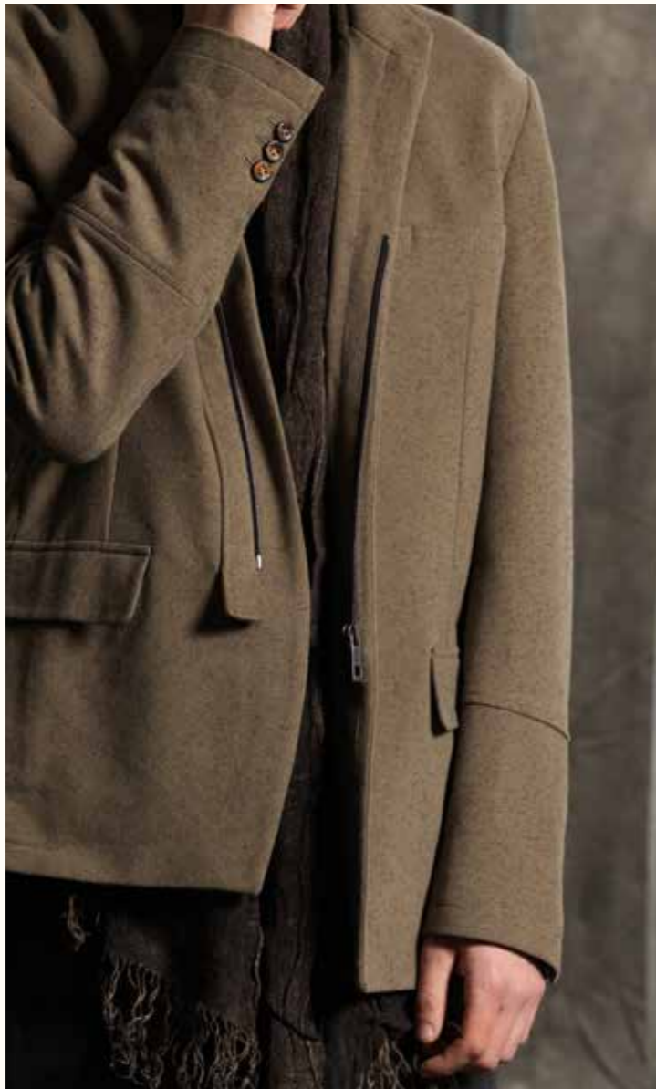
Jerseysakko Lincoln 92301 13881 8120