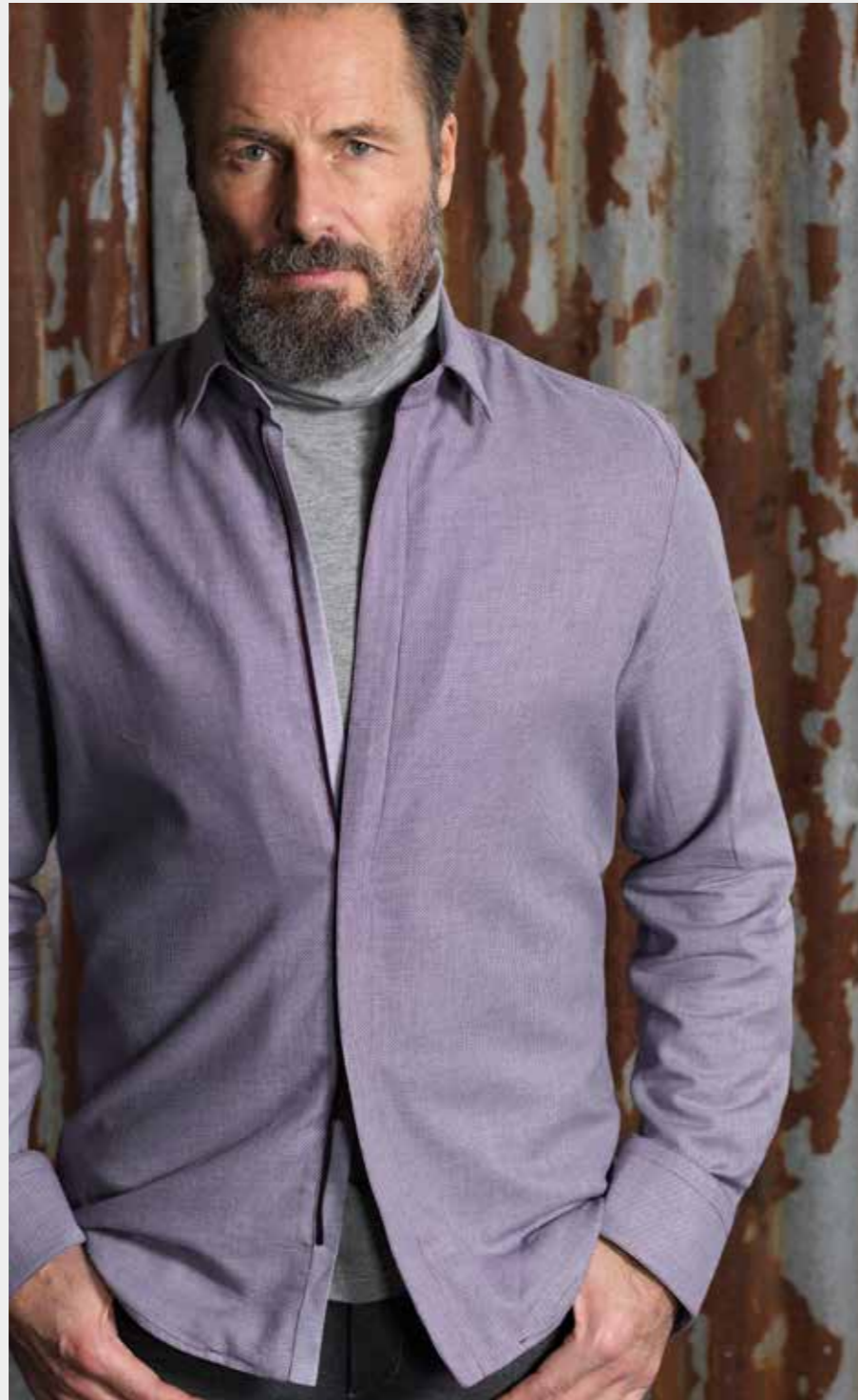
Hemd Alessio 81404 164003 8761 90