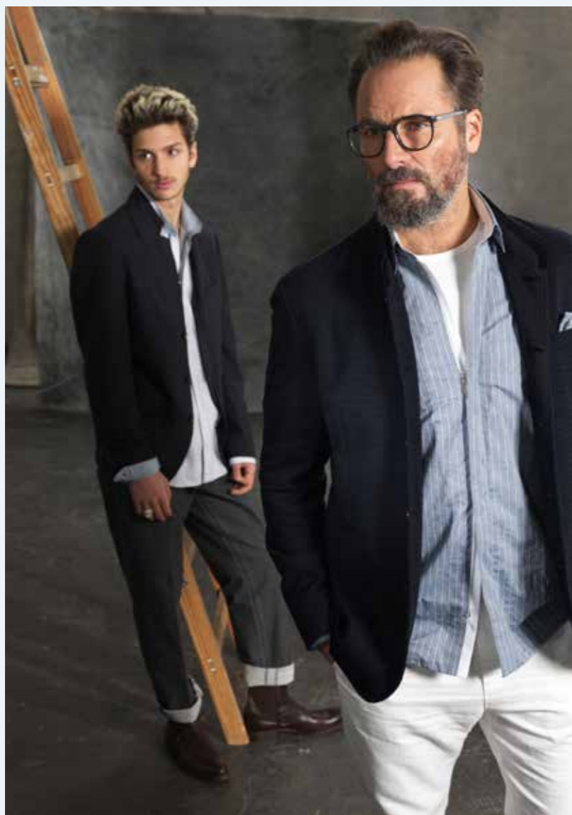
Sakko Magellan 91304 13161 8117