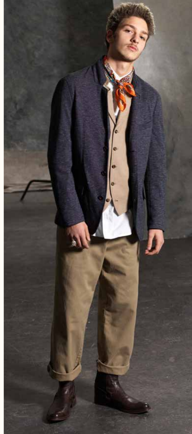
Weste Cruso 71801 10650 8112