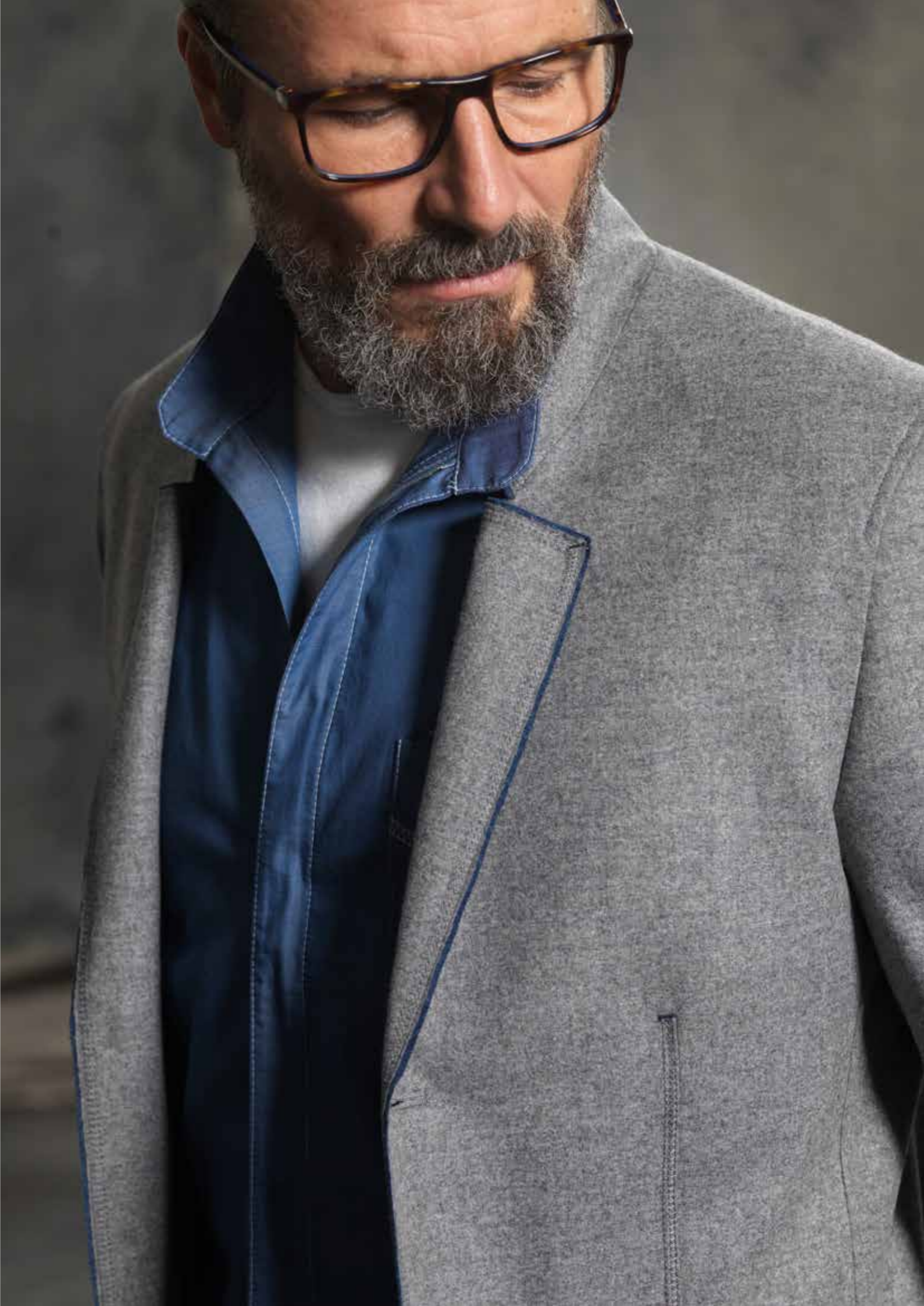
Hose Xerxes 72902 40521 8112