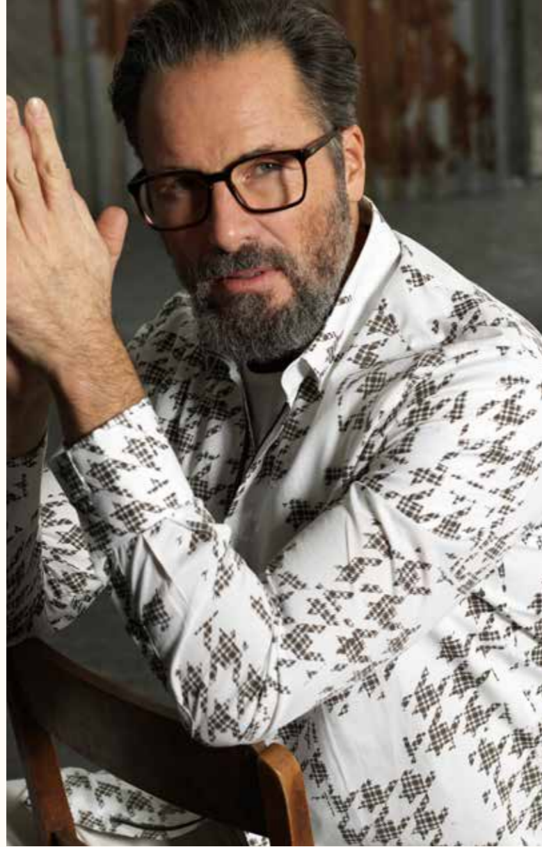
Hemd Aleandro 81401 161003 3629 75