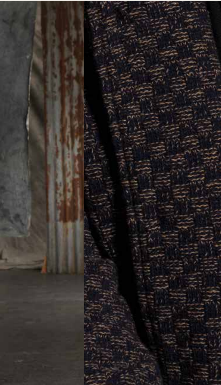
Sakko Wallace 92303 13901 8116