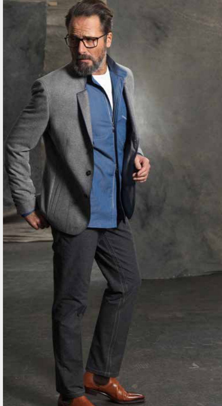
Lodensakko Payer 82308 12411 8126