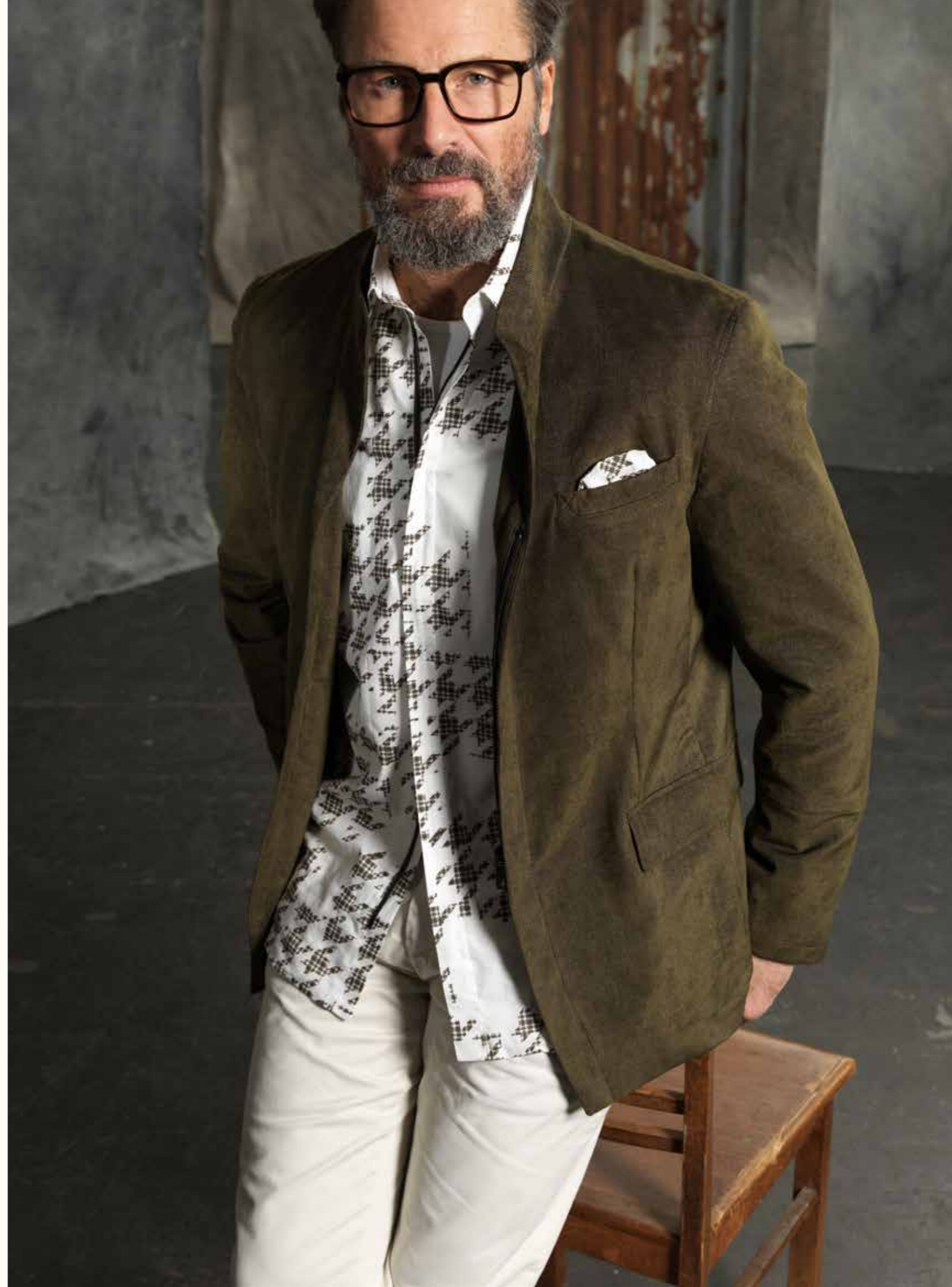
Sakko Bismarck 92301 13881 8113