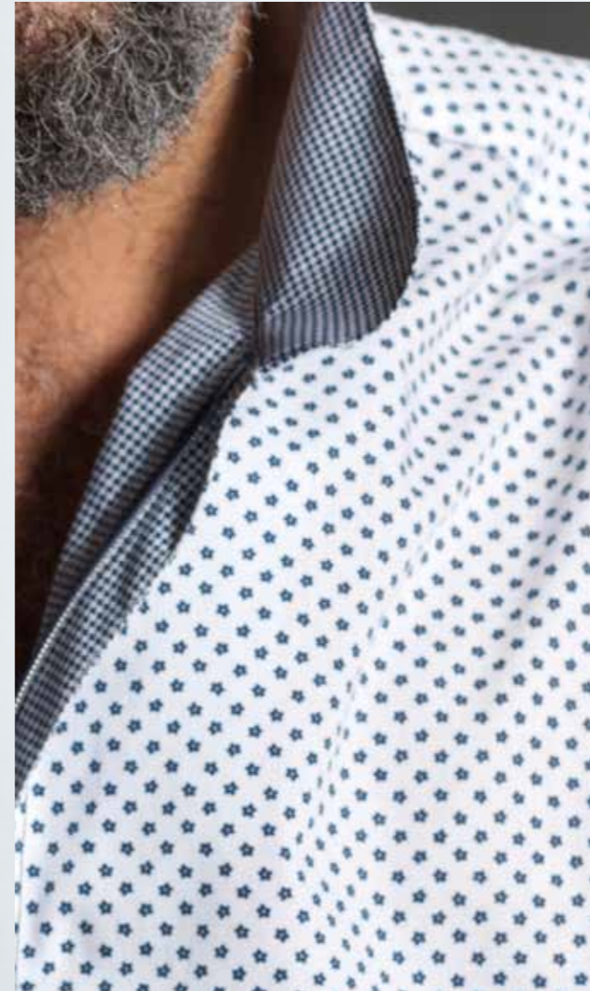
Sakko Banfield 81301 11611 8111