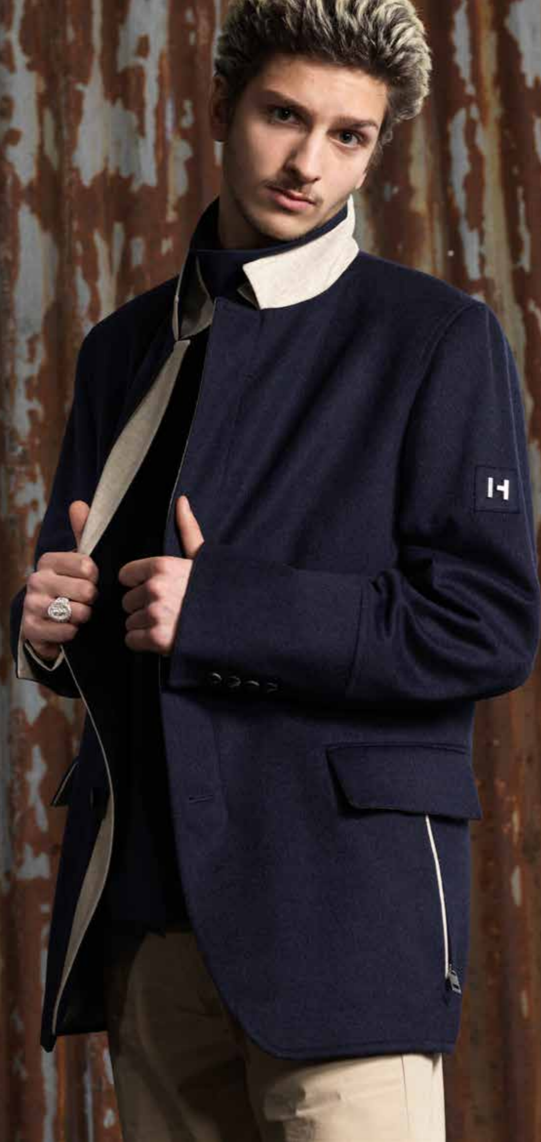
Lodenjacke Bolzano 82501 12471 8063