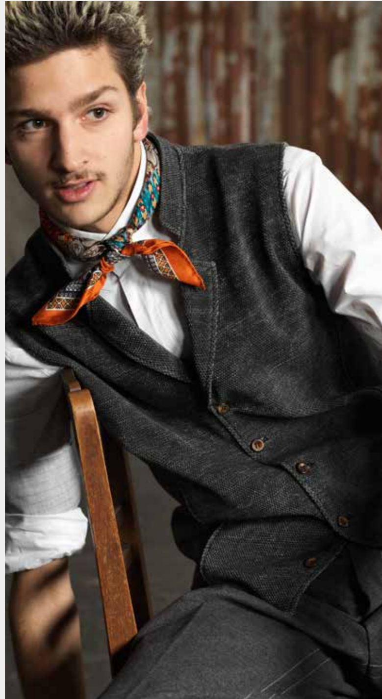
Weste Cook 71801 10650 8115