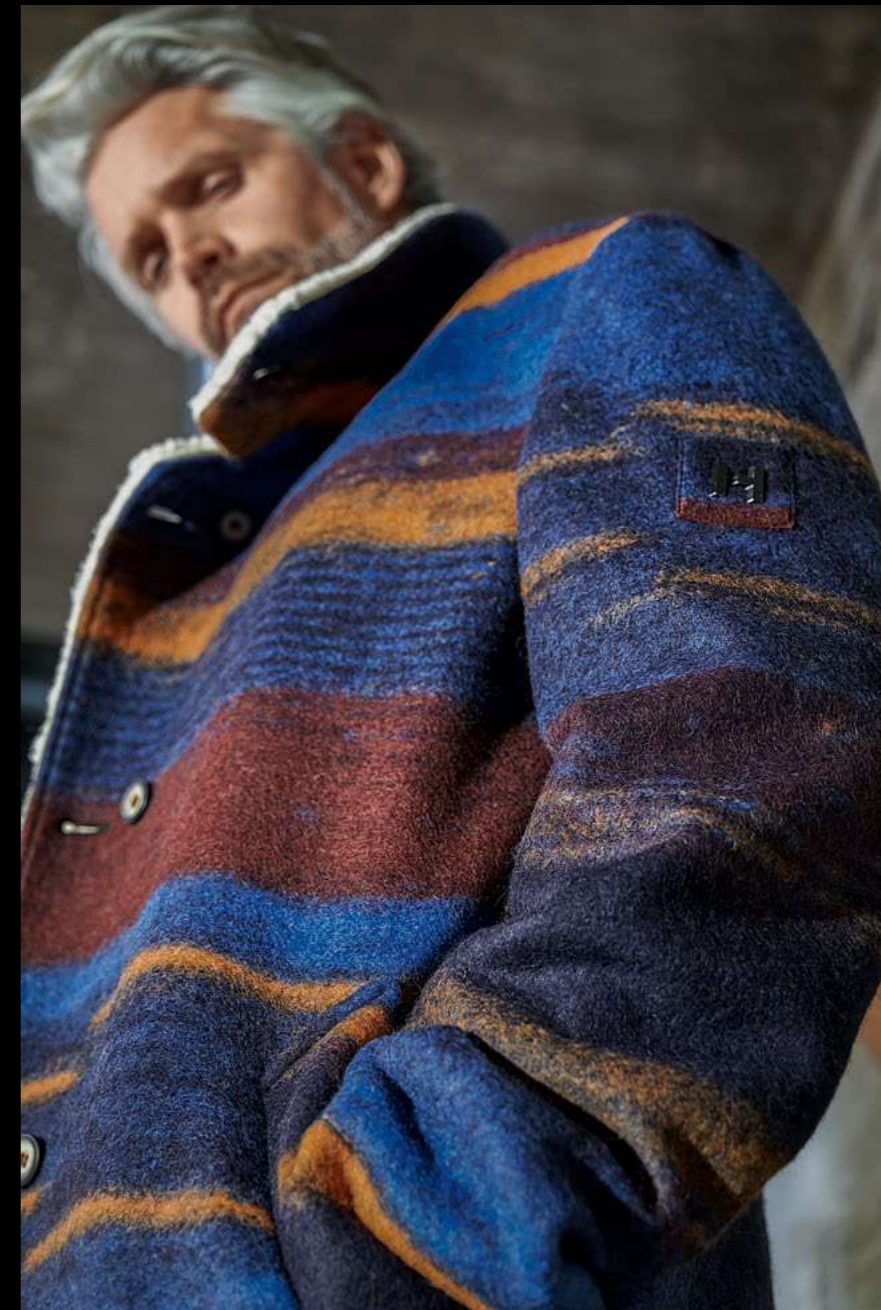
Outdoorjacke Bombieri 15211 8246

Wenn FARBEN Geschichten von Sehnsucht und Weite erzählen.