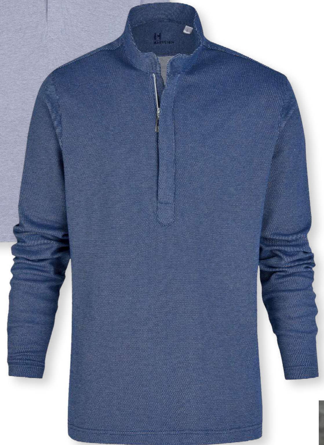
Schlupfhemd Cadamosto 82401-36