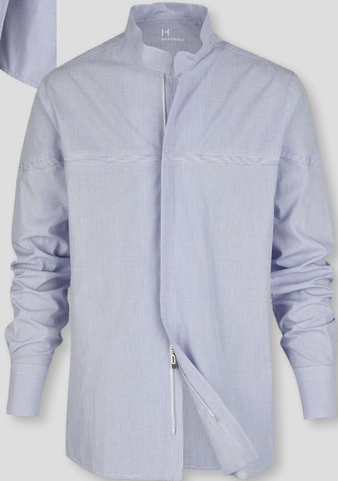
Hemd Poleni 82402-33