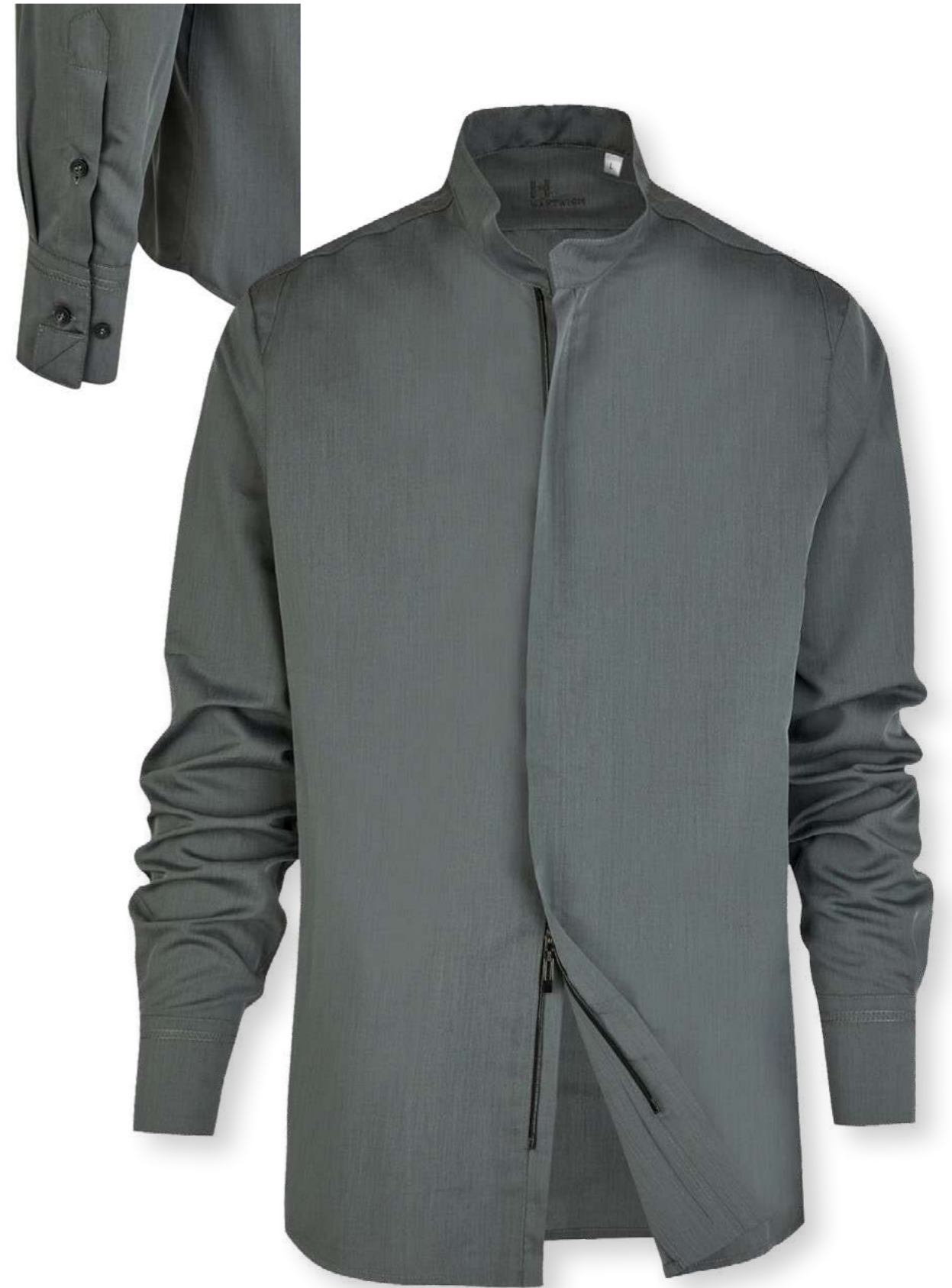
Hemd Nobile 81416-65