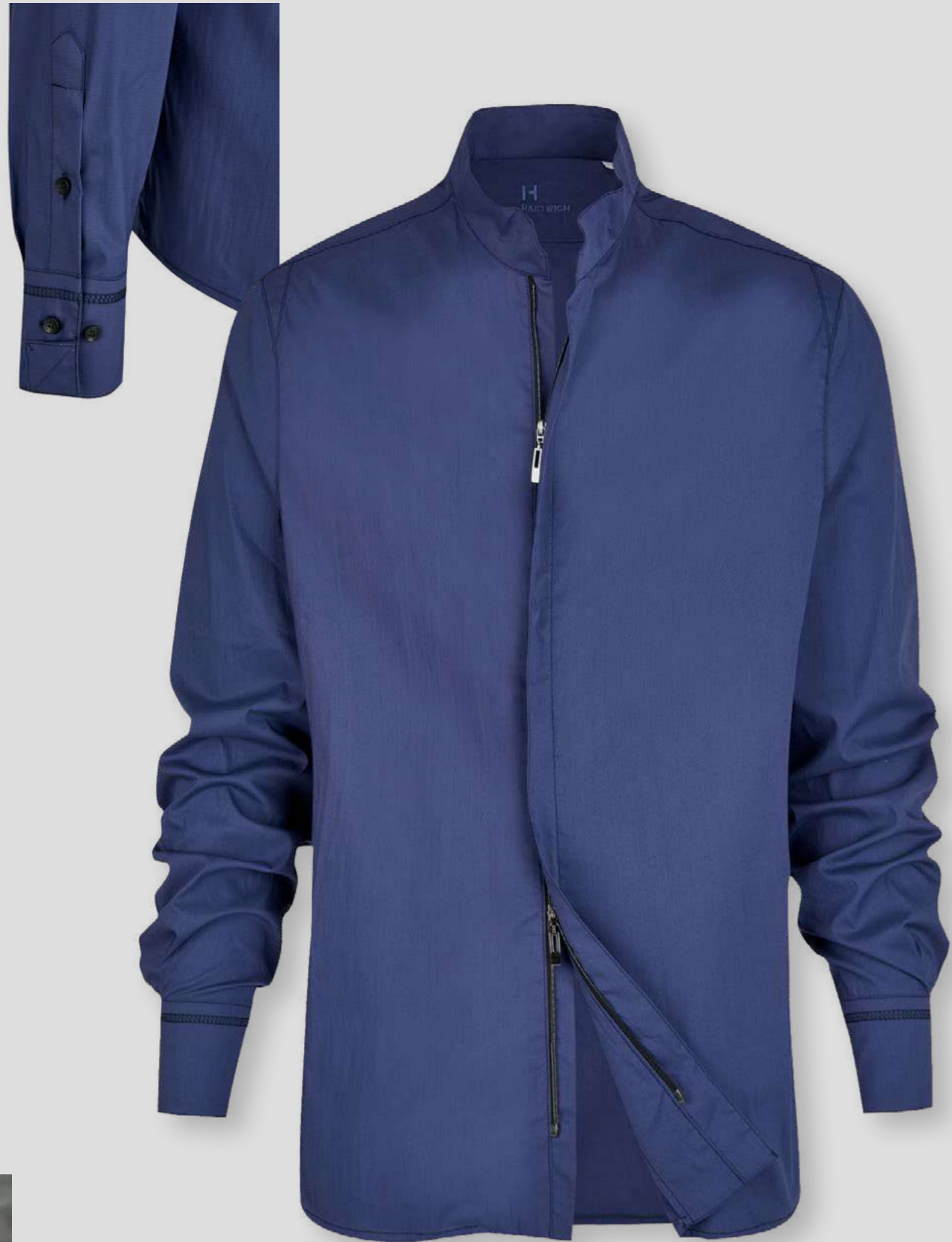
Hemd Zamboni 81416-37