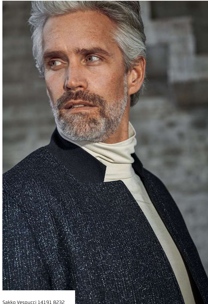
Sakko Vespucci 14191 8232