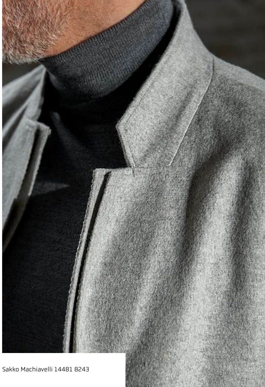
Sakko Machiavelli 14481 8243