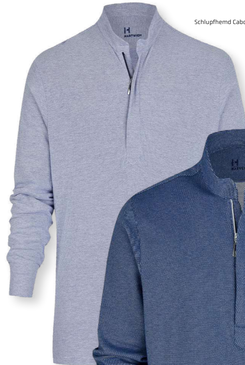
Schlupfhemd Caboto 82401-34