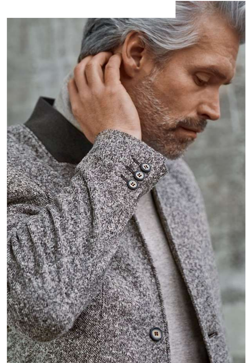
Jerseysakko Fibbonacci 14191 8238

Eigentlich ein WIDERSPRUCH: Zeitlose Mode.