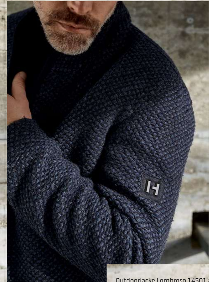
Outdoorjacke Lombroso 14501 8240