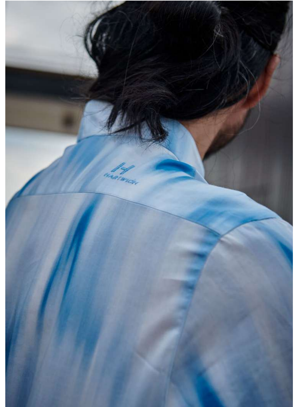
Reißverschlusshemd Florent 81416 - 32