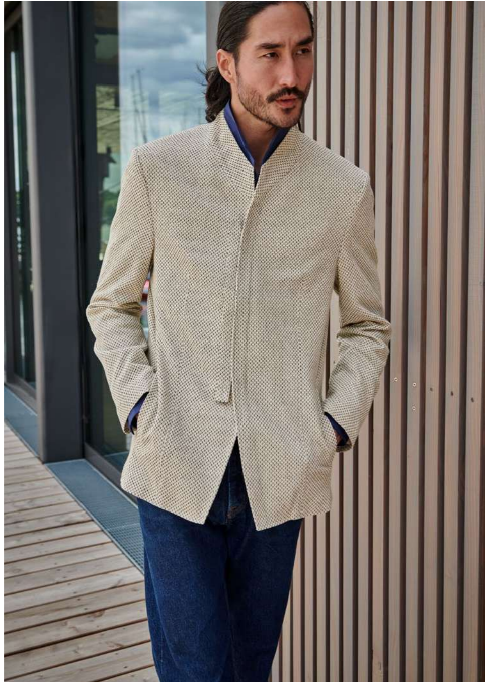
Jerseysakko Nuragus 10601 8294 Reißverschlusshemd Borgo 83423 - 37