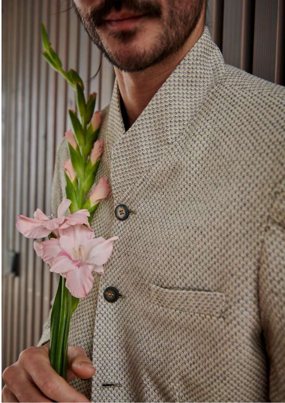
Jerseysakko Zibibbo 10611 8294