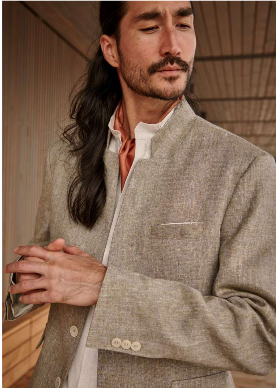
Sakko Arneis 10621 8292 Reißverschlusshemd Corte 81416 - 60