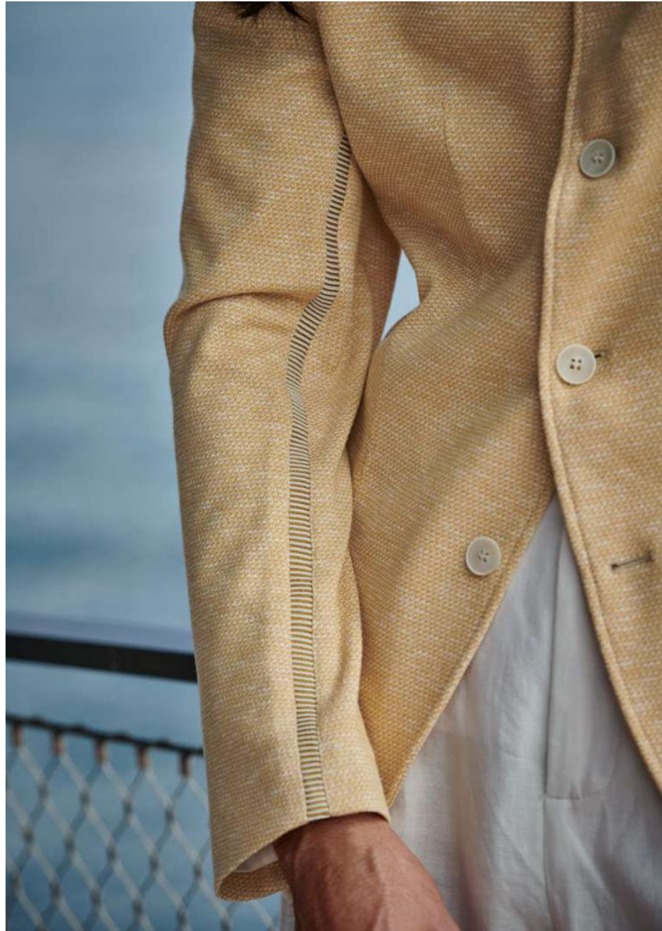
Jerseysakko Erbaluce 10591 8293