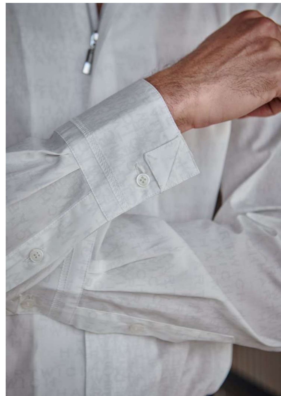
Reißverschlusshemd Corte 81416 - 60