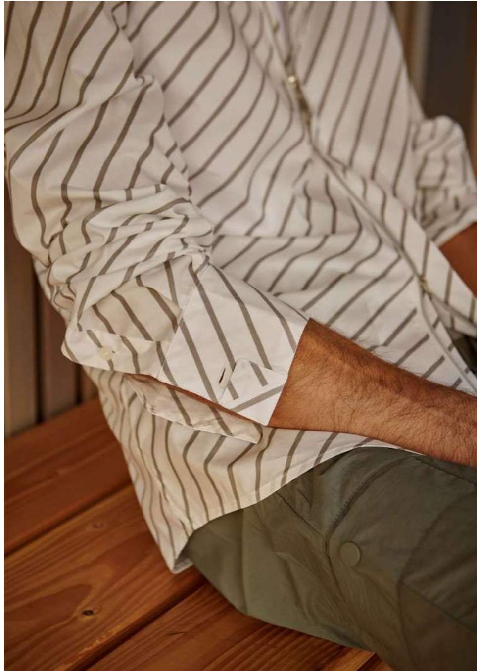
Reißverschlusshemd Bastia 81417 - 61