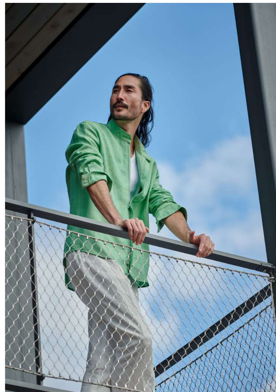
Reißverschlusshemd Calvi 81416 - 73