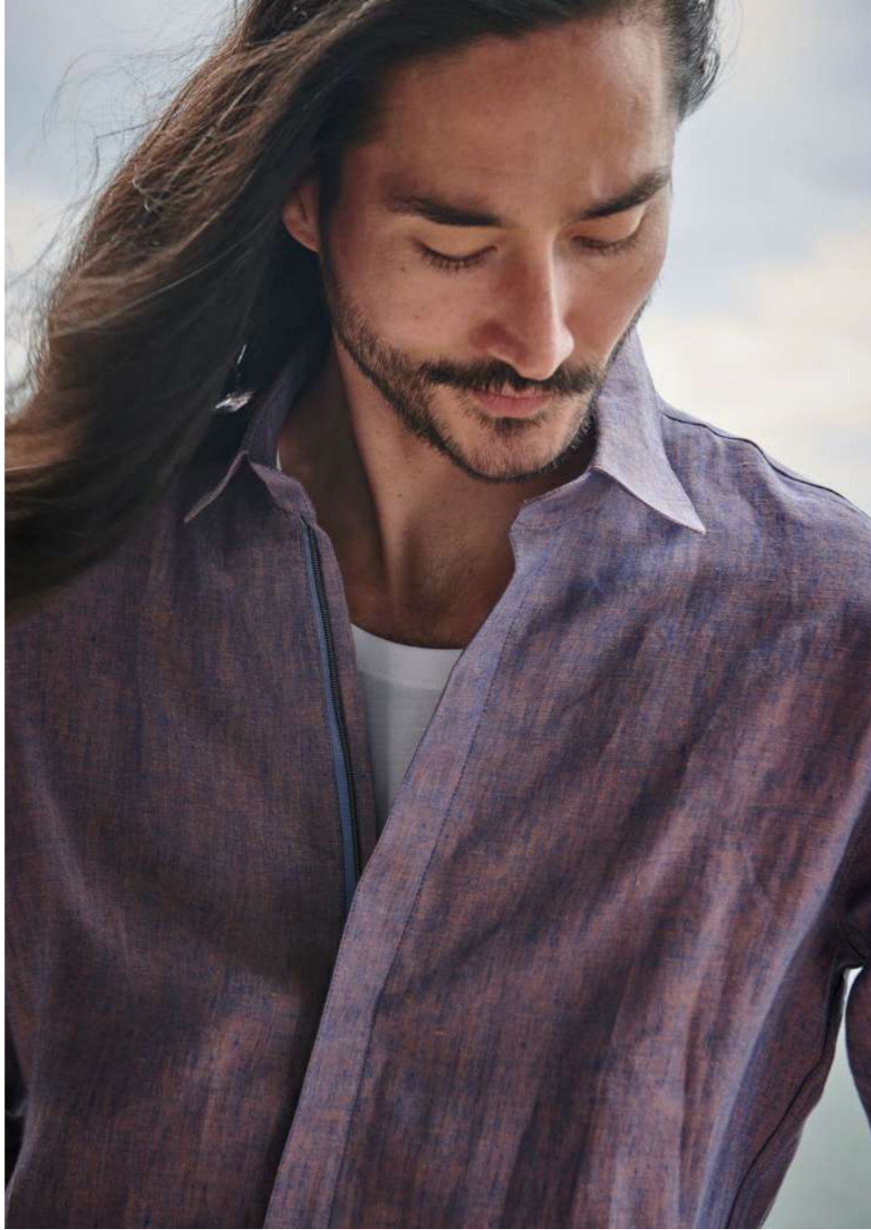
Reißverschlusshemd Sartene 81417 - 49