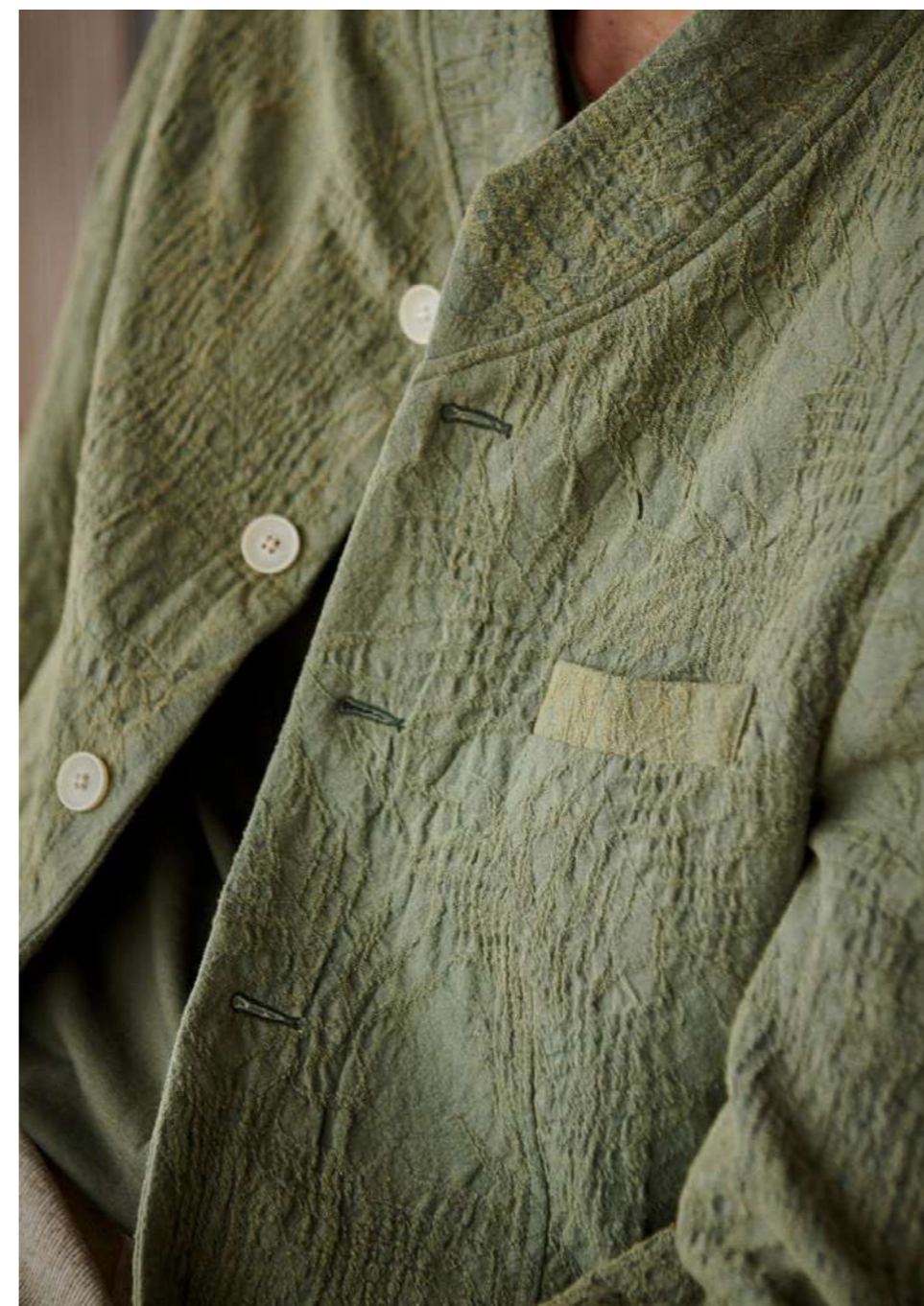
Sakko Cortese 10611 8289 Jerseyhose Greco 40683 8286