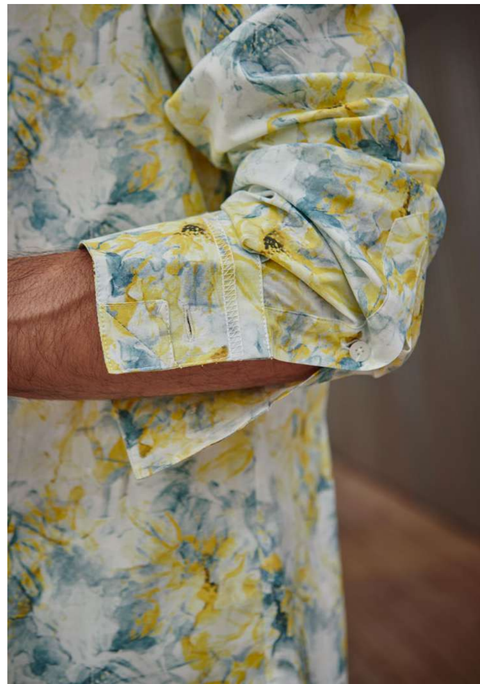
Reißverschlusshemd Cavu 83423 - 11