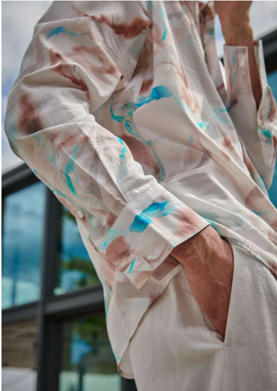
Reißverschlusshemd Rondinara 81417 - 12