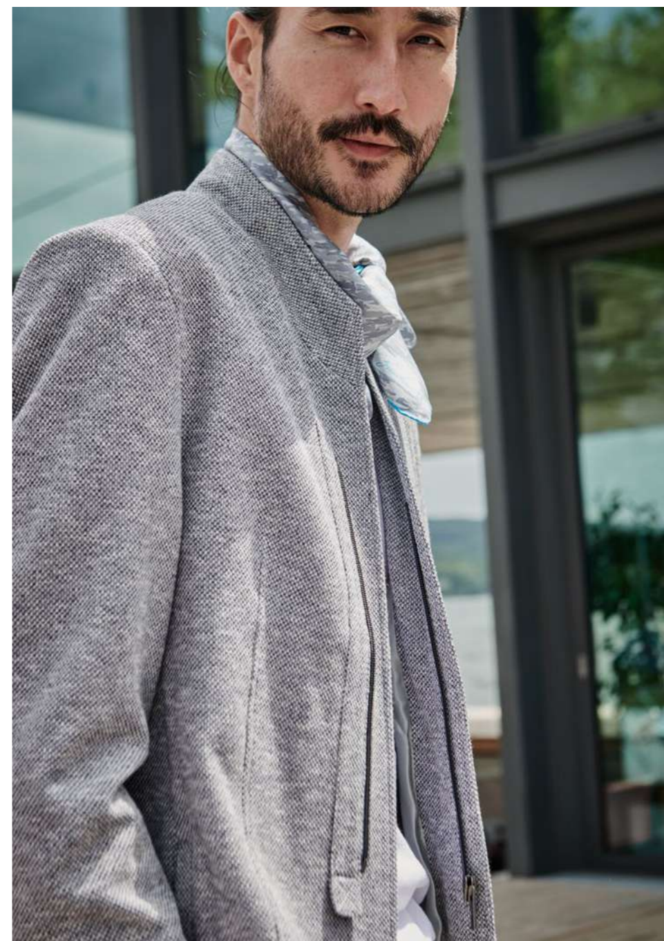
Jerseysakko Falanghina 10601 8285