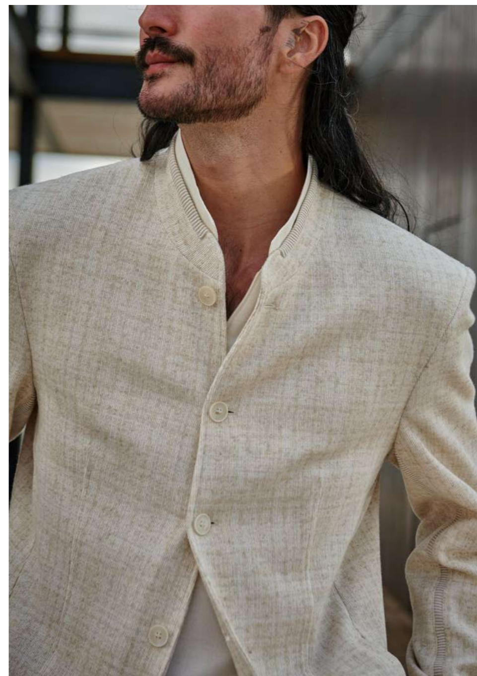
Jerseysakko Ansonica 10591 8286 Jerseyhose Greco 40683 8286