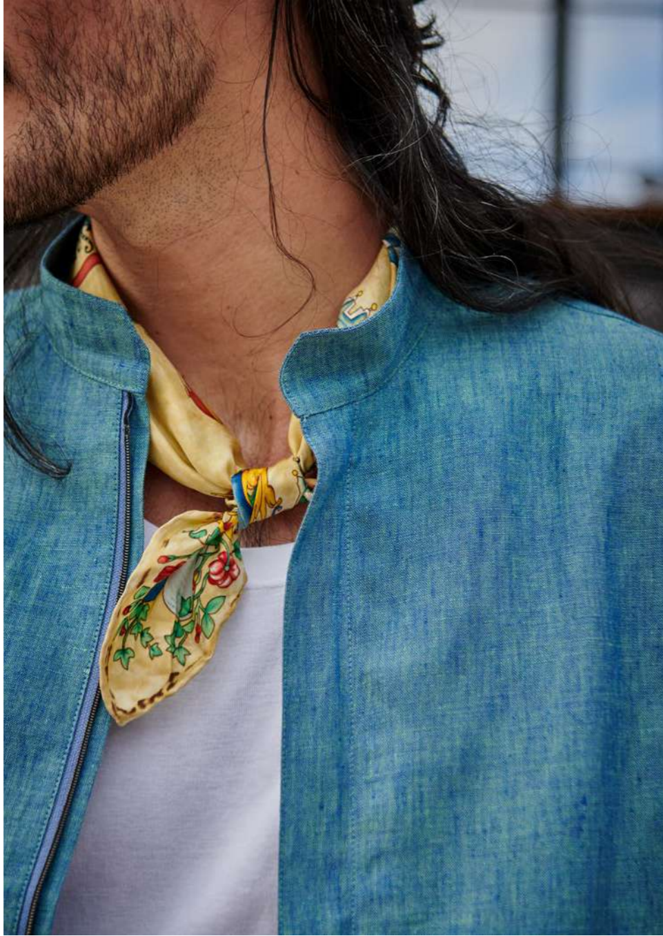
Reißverschlusshemd Porto 81416 - 35