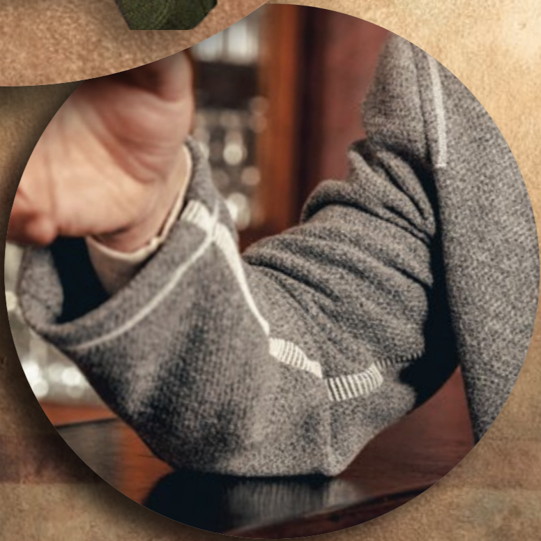
Jerseysakko Grechetto Forest 11624 8275 500 Jerseysakko Grechetto Gray 11624 8275 602