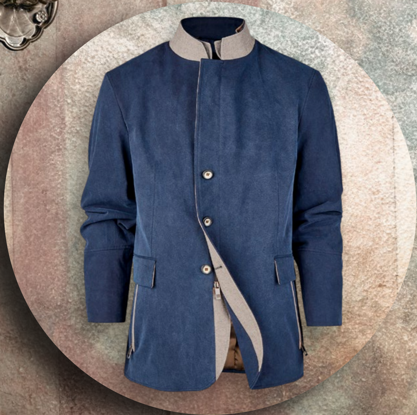
Outdoorjacke Brunello Blue 12471 8281 400 Outdoorjacke Brunello Jade 12471 8281 300