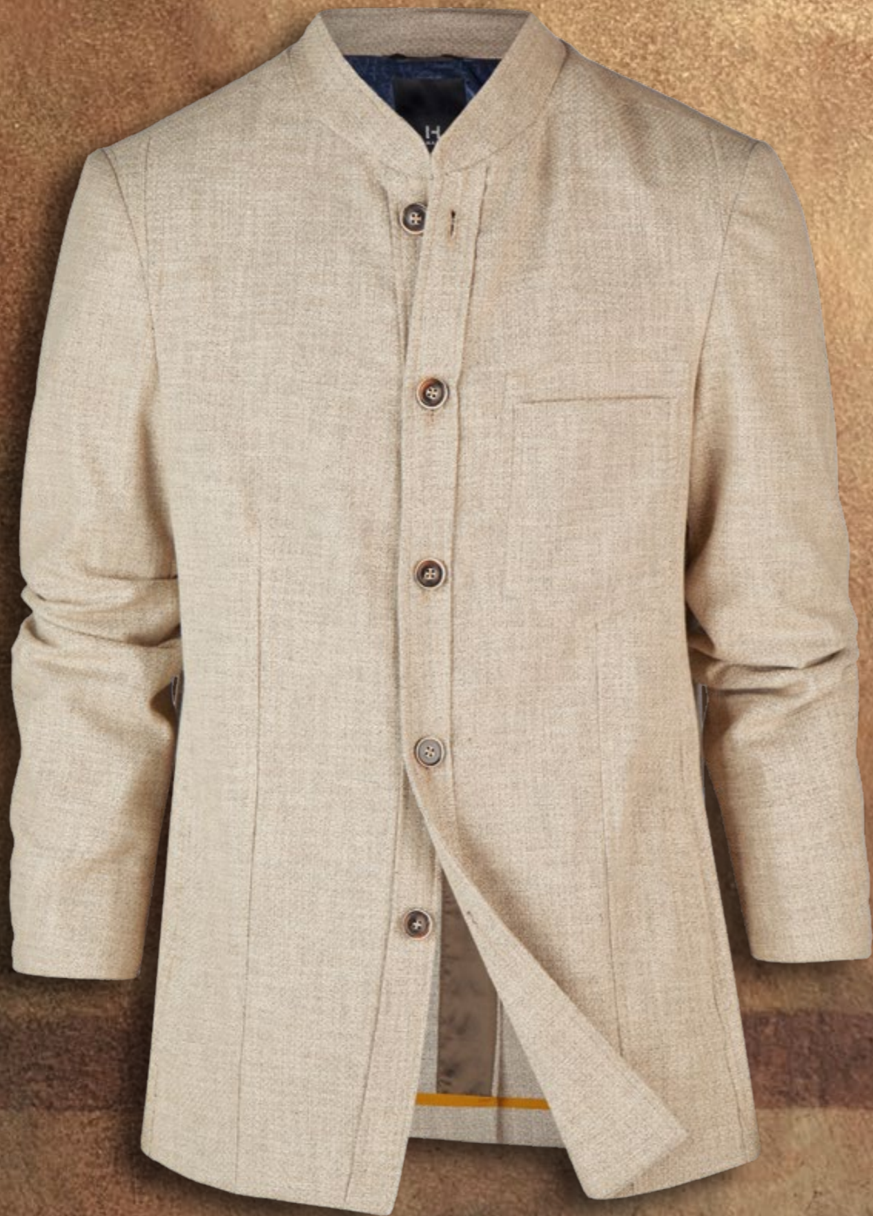
Jacke Bonarda Sand 19401 8288