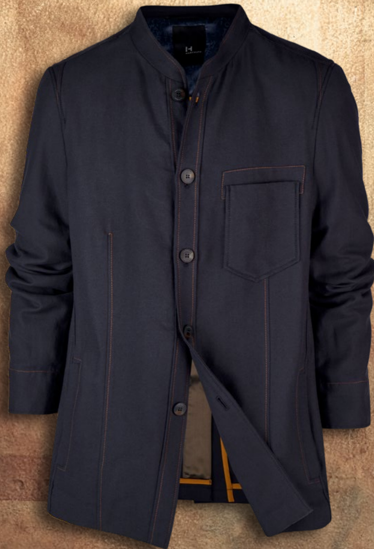
Jacke Bonarda Navy 19401 8111