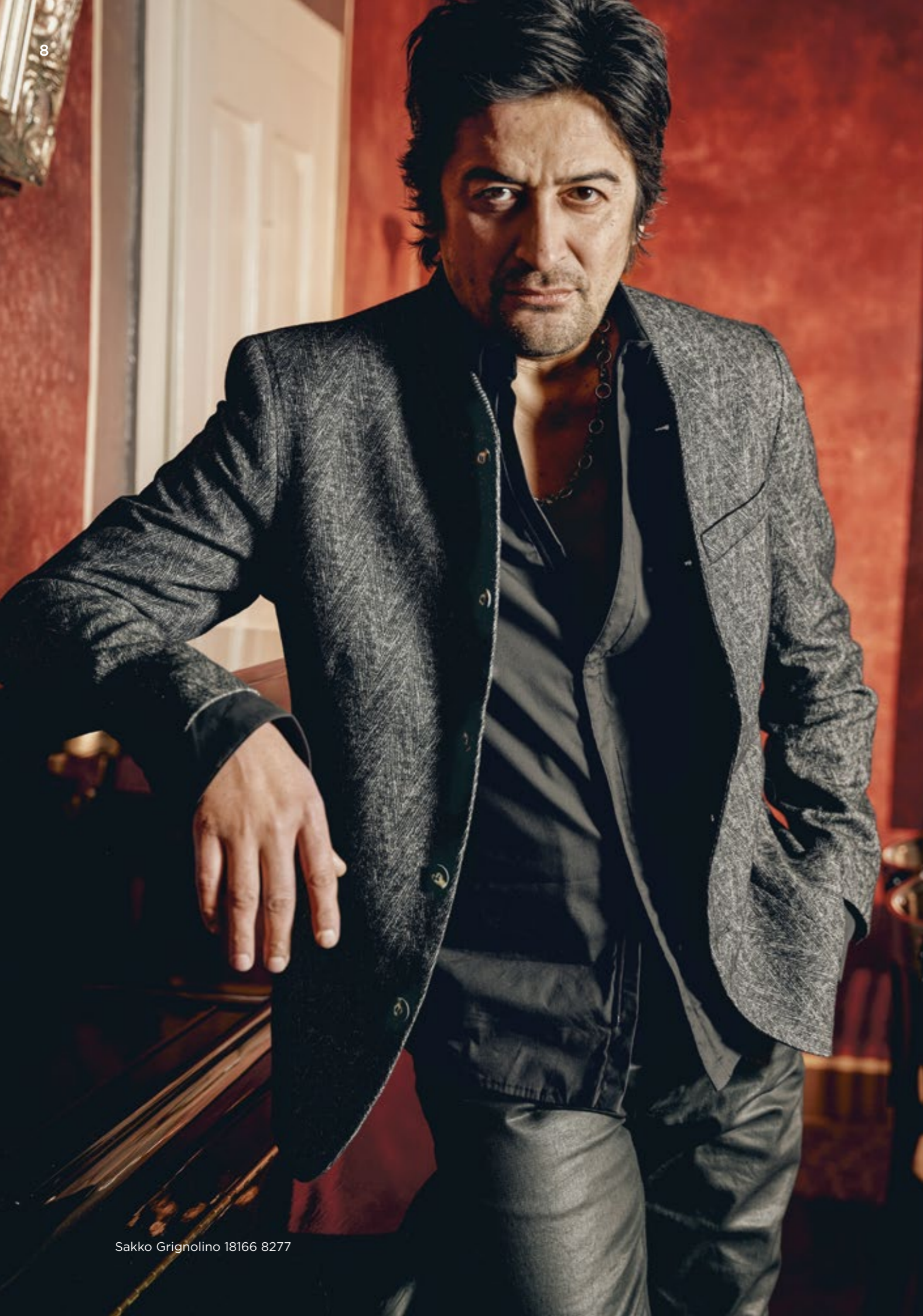
Sakko Grignolino 18166 8277