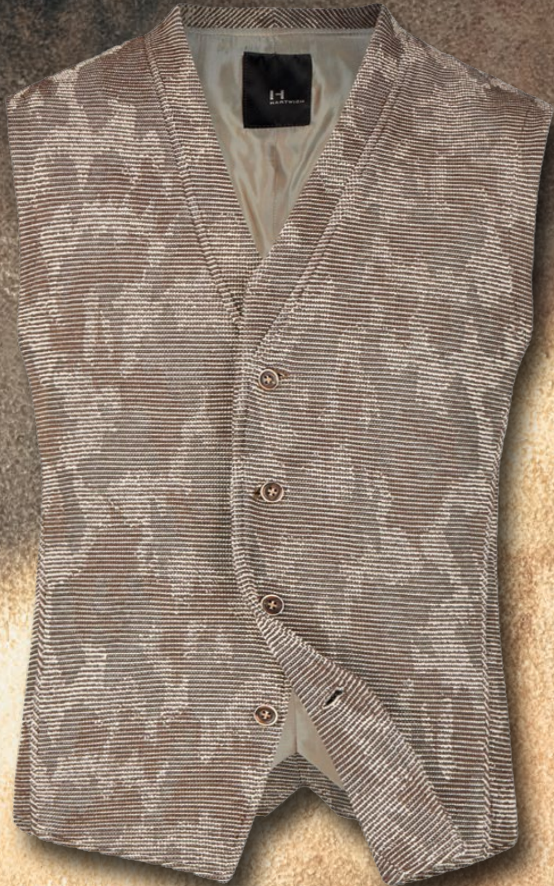
Weste Jersey-Colorino 18120 8118