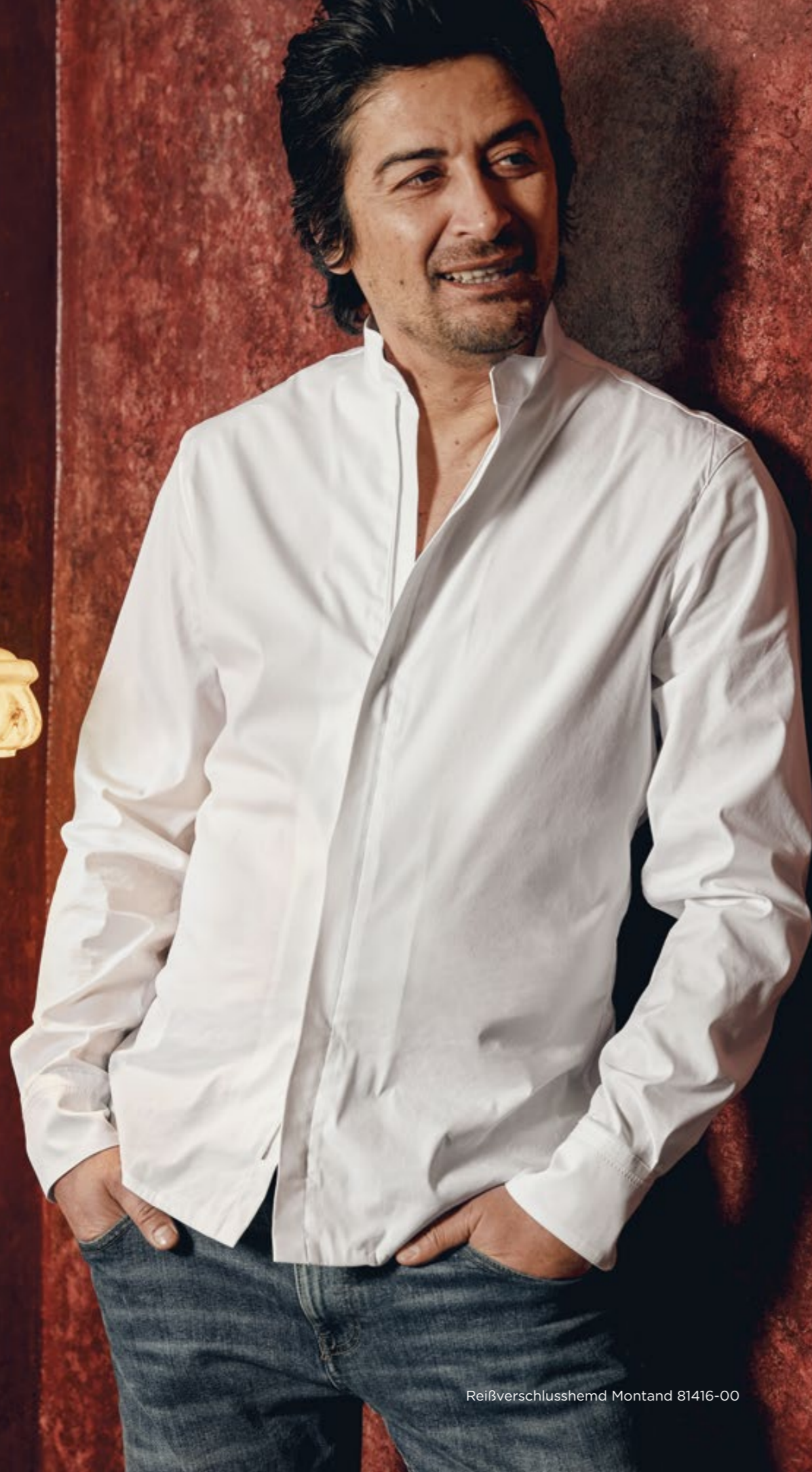
Reißverschlusshemd Montand 81416-00