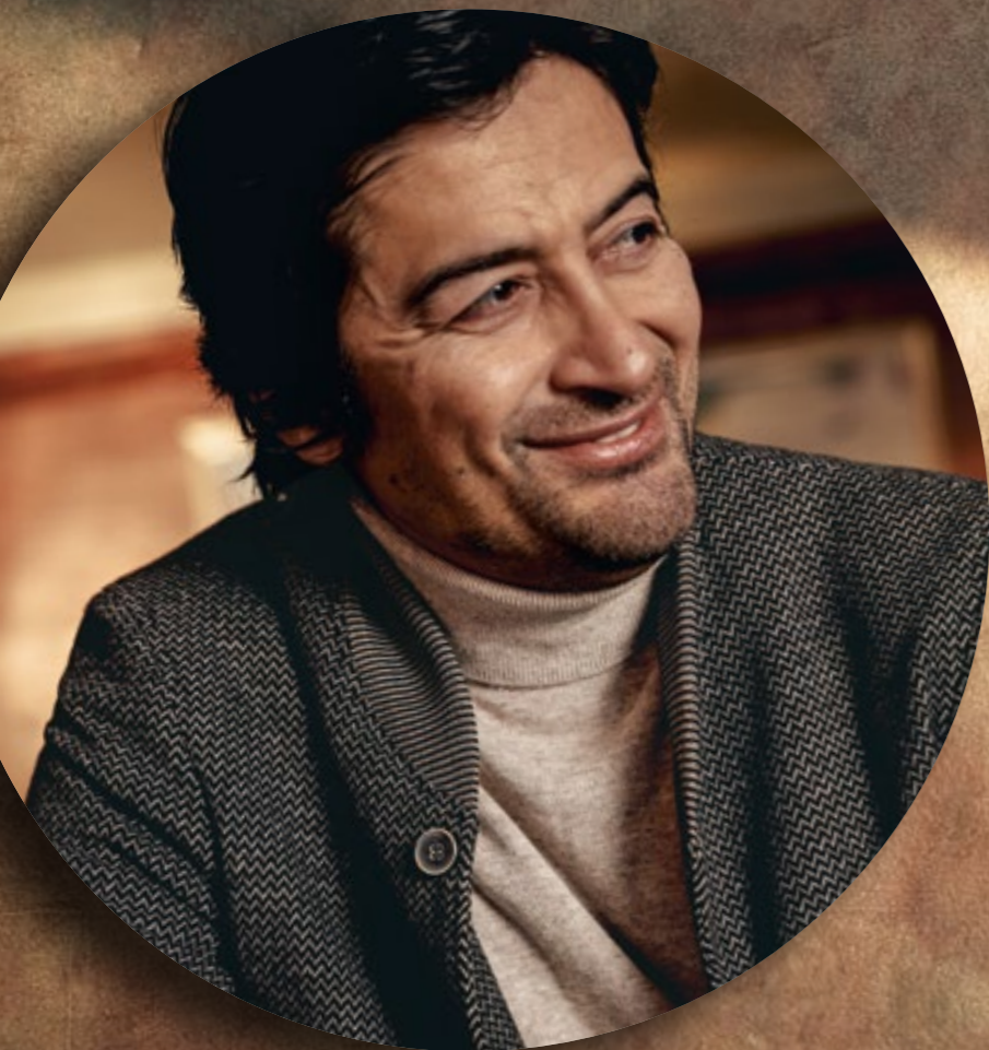
Jerseysakko Gaglioppo 18164 8280

Auf der ganzen Welt gibt es Dich nur einmal. Mach was draus.